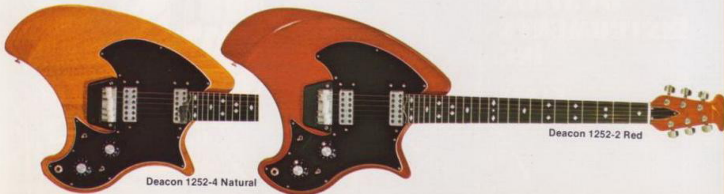
Deacon 1252-4 Natural