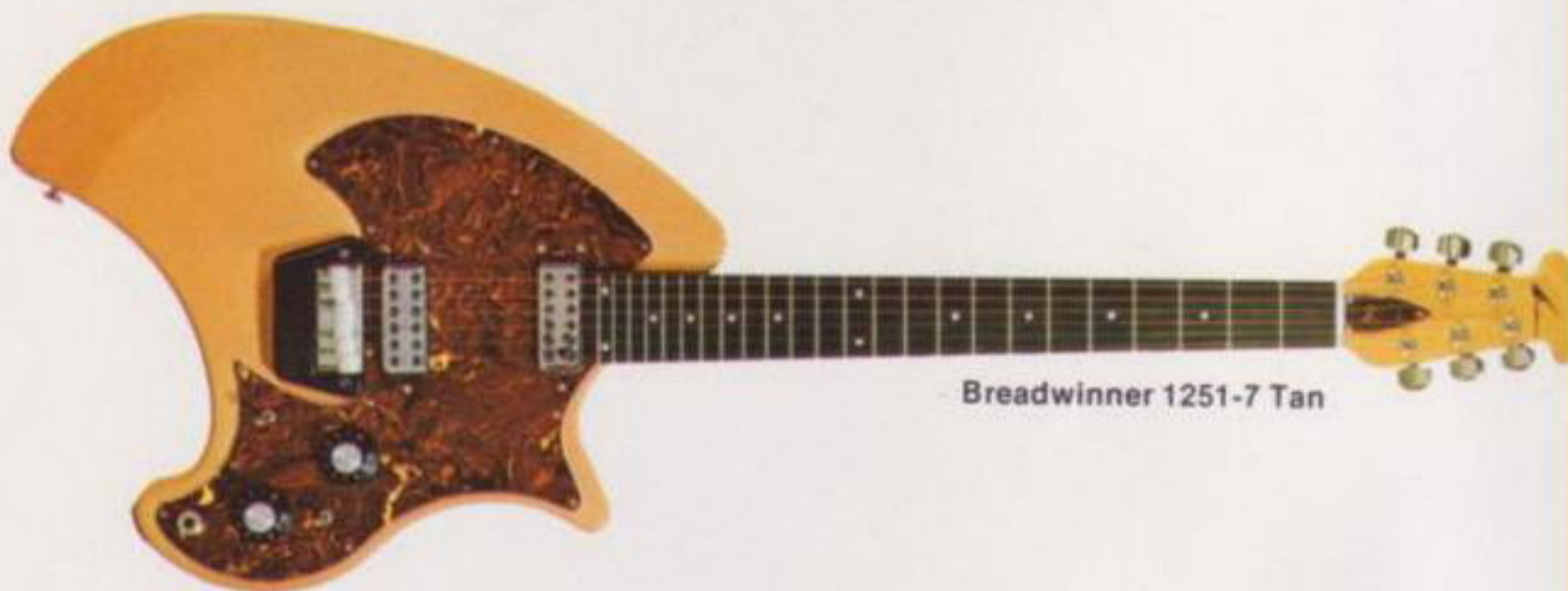
Breadwinner 1251-7 Tan