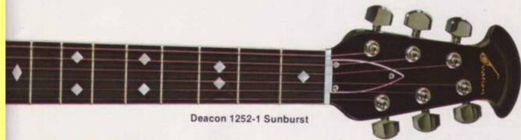
Deacon 1252-1 Sunburst