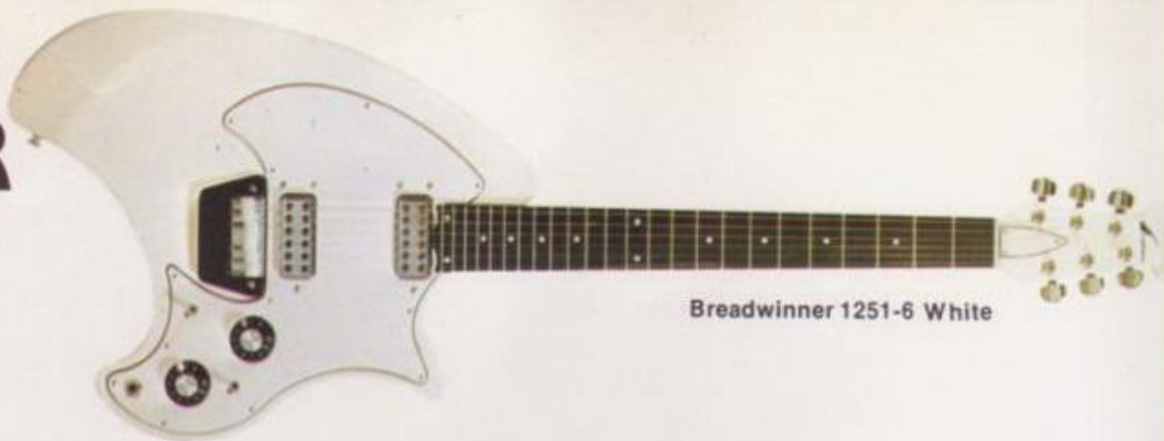
Breadwinner 1251-6 White

Die OVATION-Mechaniken (1/12) garantieren langes, sorgenfreies Arbeiten. Die Kombination Steg-Saitenhalter ermöglicht kombiniert und einzeln das Einstellen der Saitenlage (Höhe) sowie zum Einstellen der einzelnen Saiten (Bundreinheit). Die spezielle Form der Breadwinner ermöglicht es, bis zum 24sten Bund leicht zuzugreifen.