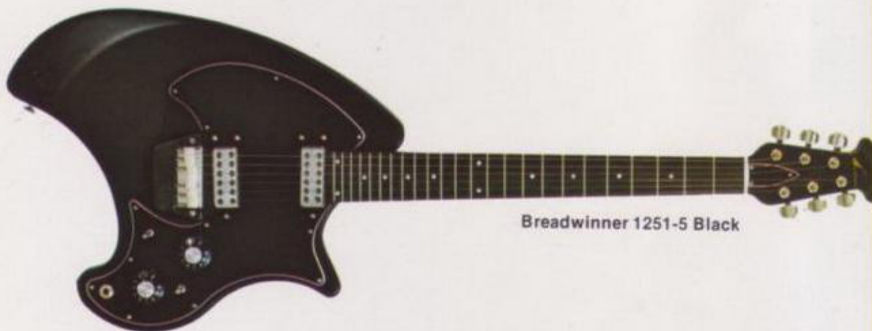
Breadwinner 1251-5 Black