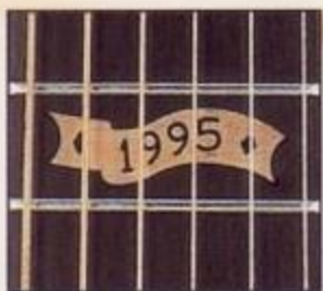
*1995* Maple Inlay at 12th Fret.