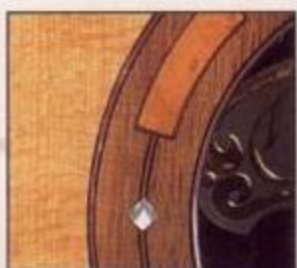
'95 Collectors' Special Rosette. Walnut, Maple, Abalone.