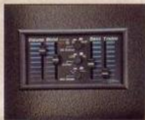
In Addition to Giving You Flexible Eq, The New OptiMax System Lets You Dial in Just The Right Balance Between Pickup and Microphone.